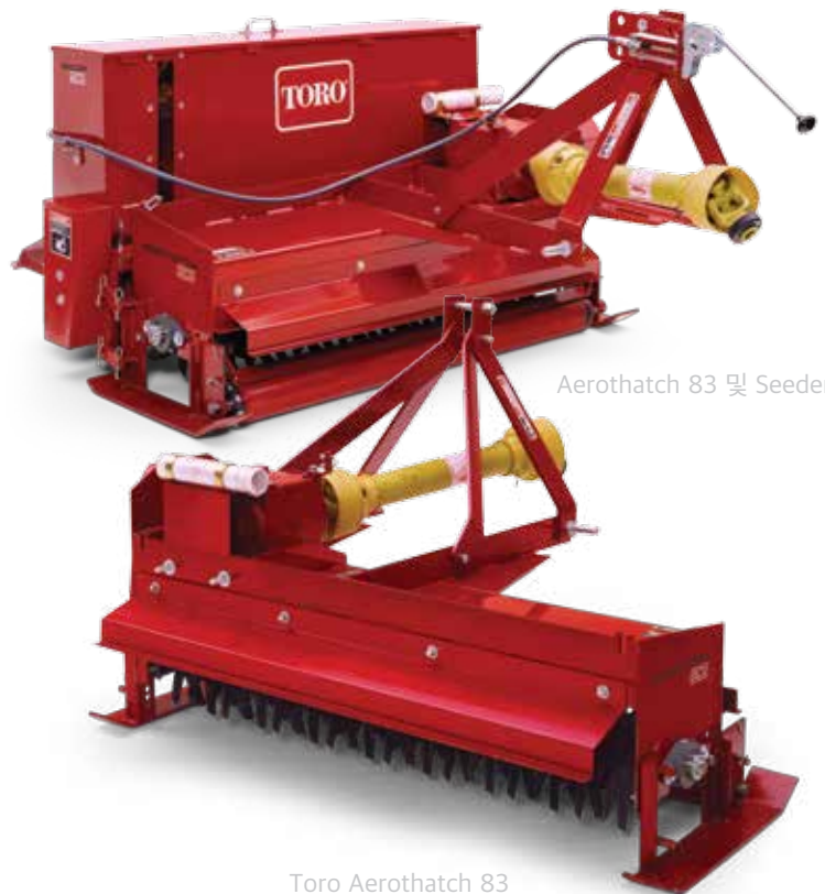
Aerothatch 83 및 Seeder 93

67.1 kW 등급의 기어박스는 아무리 힘든 조건이라도 버틸 수 있으며, 수명도 깁니다. 이 장비에는 16개의 내구성이 있는 덧취 작업 블레이드가 중심부에 7.2 cm 간격으로 배치되어 있으며, 7.2 cm 깊이까지 작업할 수 있습니다. 가운데 덧취 작업 블레이드 키트에서는 보다 공격적인 통기 작업을 위하여 2.5 cm를 사용할 수 있습니다. Aerothatch 83과 짝지어진 Seeder 93은 간단한 원패스 구성으로 덧파종 작업을 효율적으로 할 수 있습니다. 씨앗은 16개의 독립적인 채널을 통해 Aerothatch 83이 효율적으로 씨앗을 발아하도록 만들어 놓은 흠까지 흘러갑니다. 이동 속도는 공구를 사용하지 않고 쉽고 빠르게 설정합니다.